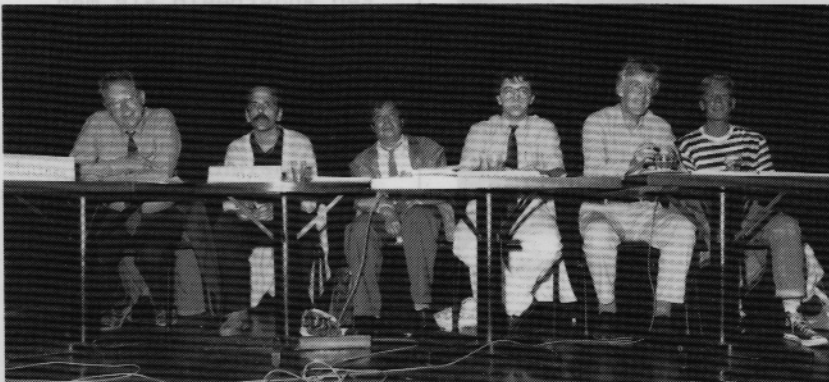
overzicht van het forum

'Seksueel gedrag tussen een volwassene en een kind wordt niet geaccepteerd'