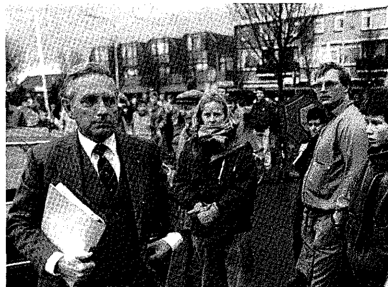
Minister van Justitie Korthals Altes op bezoek in Oude Pekela.

ren, blijft dit land kwetsbaar voor de Amerikaanse invloed die zijn samenleving nog meer zal verzieken. Er is heel wat dat de Amerikanen van de Nederlanders kunnen leren. Het culturele verschijnsel in de Verenigde Staten dat men zich blindstaart op onbereikbare morele waarden waarbij men zich een, overigens aanvechtbaar, superioriteitsgevoel aanmeet met een onvermijdelijk daarmee gepaard gaande hypocrisie, staat genuanceerd denken in de weg en houdt het mechanisme van de zedenangst in stand. Het onvermogen om zich de Nederlandse flexibiliteit eigen te maken of zelfs maar te begrijpen of te respecteren, is kenmerkend voor het Amerikaanse bewustzijn. Nederland is tenslotte maar een klein landje.