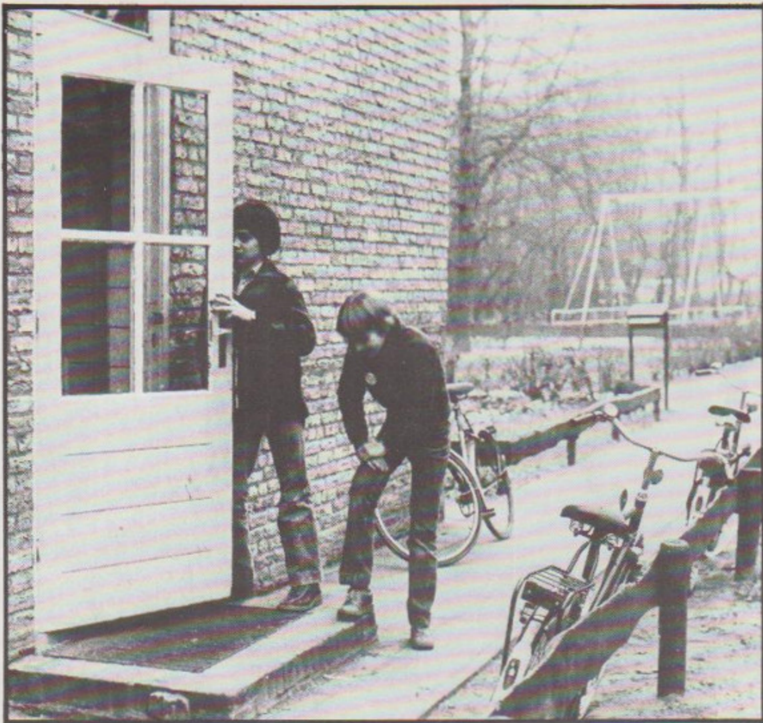
Na het interview: door de keukendeur naar binnen.