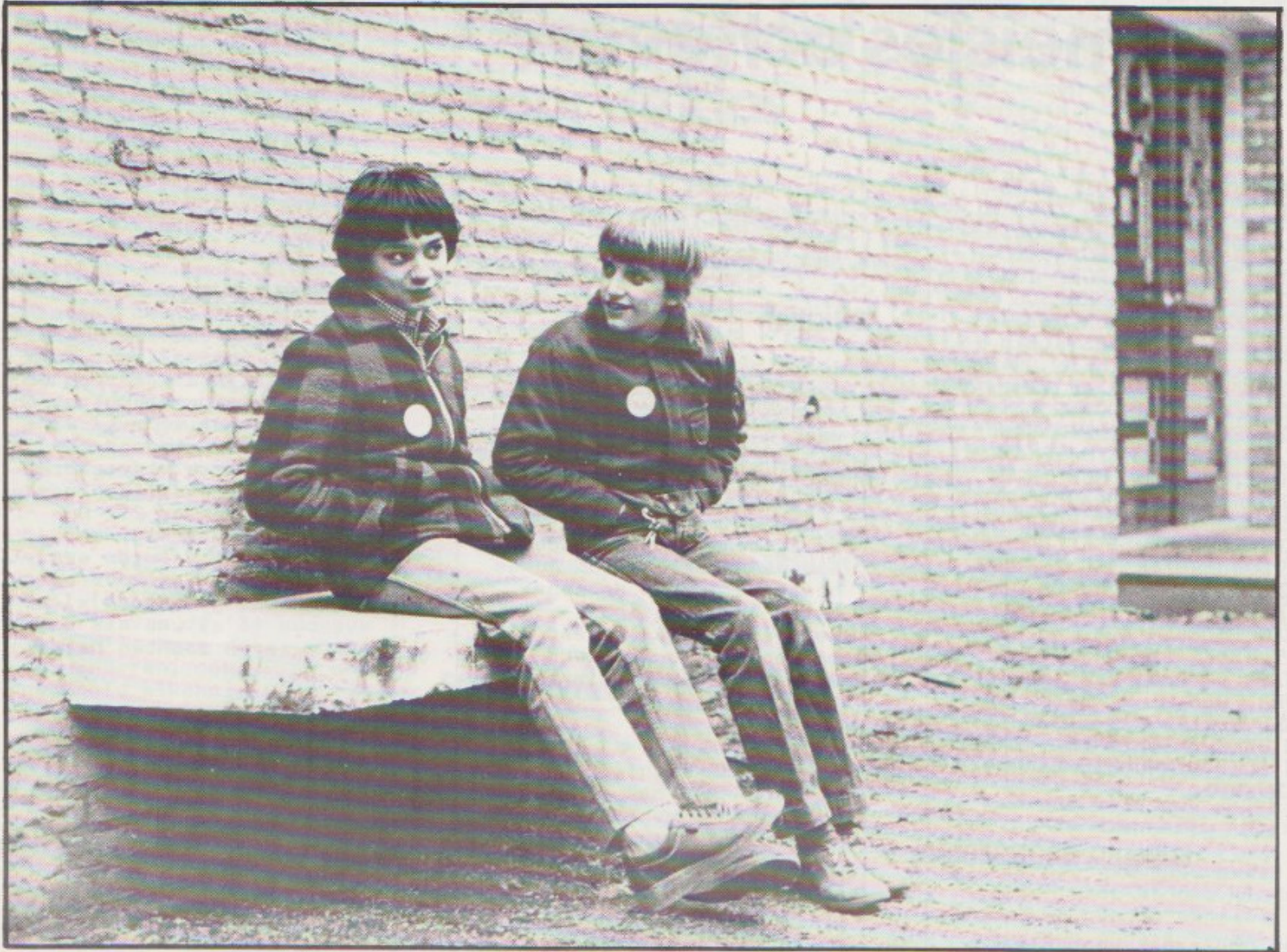
De enige tehuusbewoners in Kindervuist.