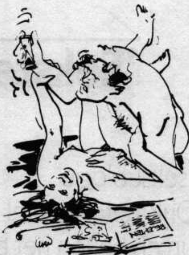
Tekening Lian Ong

'Mannen hebben seks lang als kookrecept gezien: vijf minuten borsten, vijf minuten clitoris en dan verder'