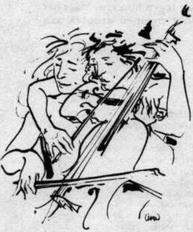
Tekening Lian Ong

'Seks kan net zo verfijnd zijn als de muziek van Bach'