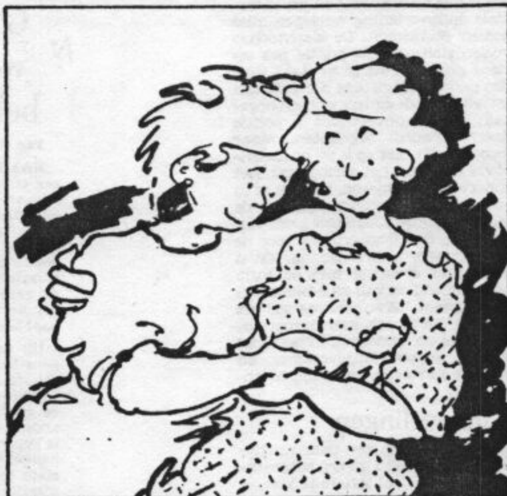
ILLUSTRATIE: Elly Hees

Toen de zoon des huizes moeilijk begon te doen, zocht mevrouw Levering contact met Bettie Nieweg van de Vereniging Ouders van een homoseksueel kind, die haar aanraade om