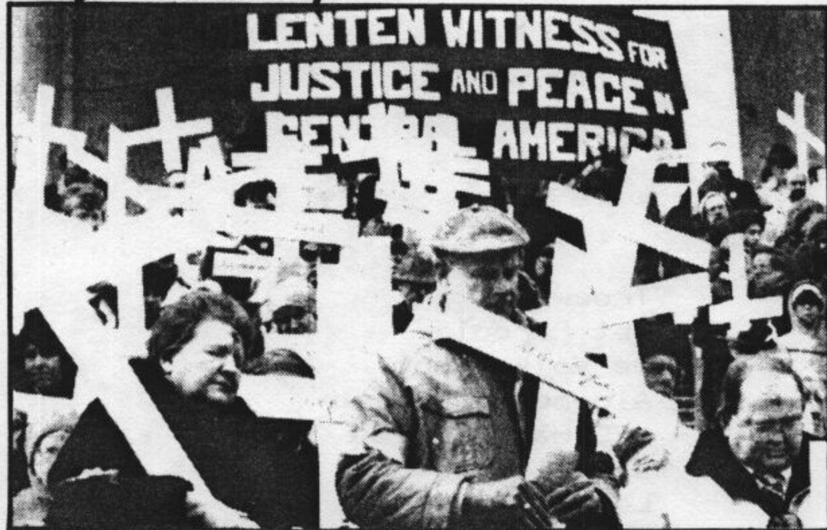
Woensdag, aswoensdag, het begin van de vasten, hebben aanhangers van verschillende kerken op de trappen van het Capitool betoogd tegen de Amerikaanse inmenging in Midden-Amerika. Op de meegevoerde kruisen stonden de namen van slachtoffers. De betogers zijn voornemens tijdens de vastentijd elke woensdag op deze plek terug te komen, onder meer om te bidden voor een andere politiek tegenover Nicaragua.

De president plaatste in zijn vonnis de verschillende door het COC gewraakte passages in het geheel van het interview. In zijn vonnis heeft de president bij de omstreden passages telkens de gewraakte zin of uitdrukking in het geheel van het interview geplaatst.