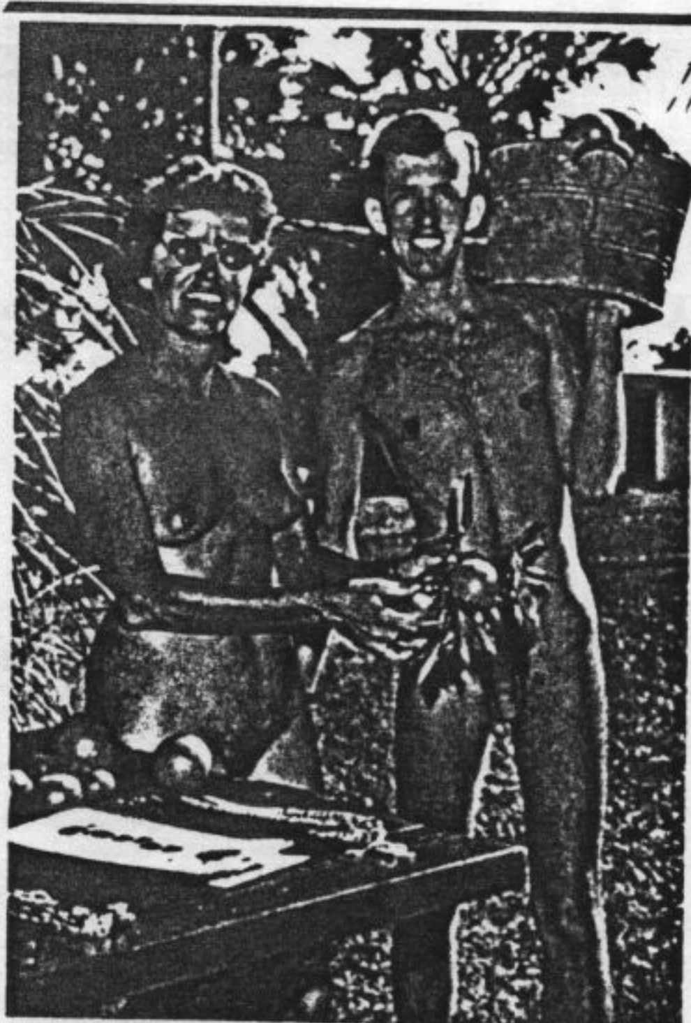
'Hoewel de gezondheidsaspecten van het sociale nudisme een belangrijke motivatie is geweest voor duizenden leden, kan terecht worden gekonstateerd dat de wens om een staat van relatieve vrijheid te bereiken overheerst. In een nudistische omgeving is er niet alleen sprake van een totale afwezigheid van beperkende kleding, maar ook van een mentale vrijheid - een vrijheid van gedachten die niet langer gekoppeld zijn aan verouderde concepten van schaamte, die geassocieerd wordt met het menselijk lichaam.'