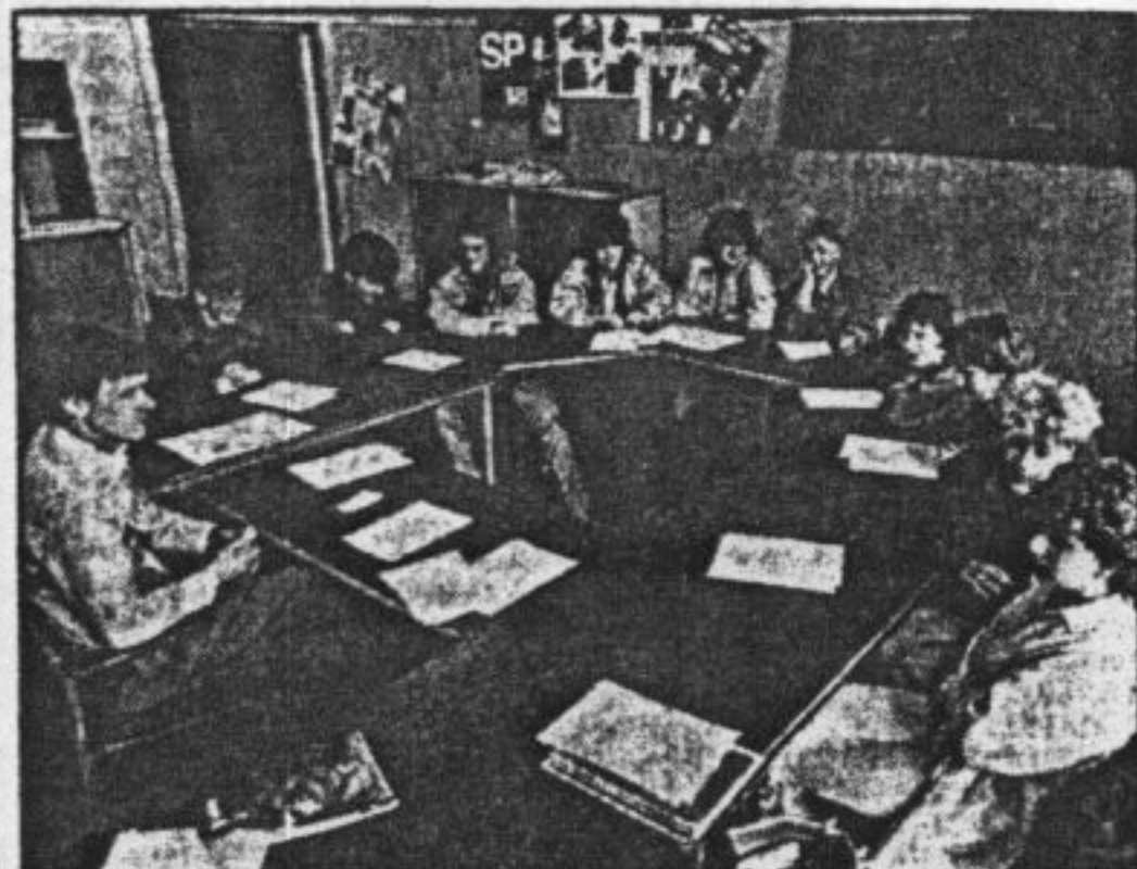
● De chr. KMBO-leerlingen storten zich in de discussie over een heel teer onderwerp: incest! (Foto: Jelte Homburg).

Dit was het resultaat van het kringgesprek over incest, gehouden door leerlingen van het Chr. KMBO te Groningen, klas Oriëntatie 1B. Wij konden helaas niet de hele discussie opschrijven, dan zou het veel te lang worden zijn, want je kunt er wel een heel boekwerk van maken.