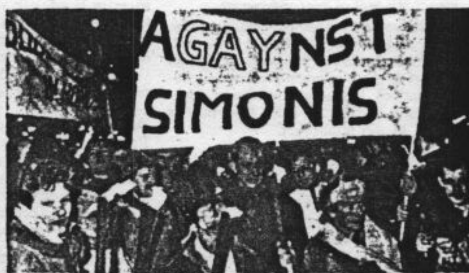
DE HOMO-BEWEGING demonstreerde met een fakkeloptocht

IN de zaak Simonis, is het immers duidelijk dat het niet om het belang van één individuele homoseksueel gaat maar om het belang van de vele homoseksuelen, namens