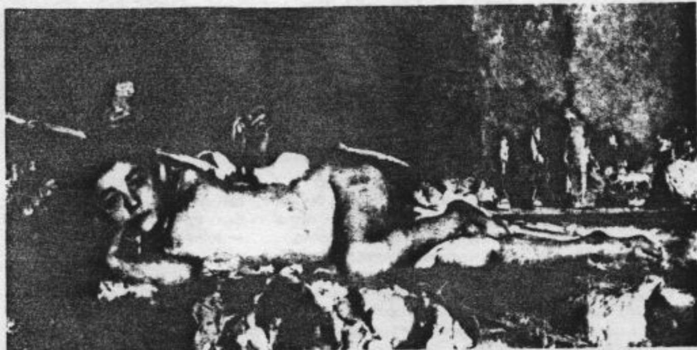
Antonio Mancini: 'De beeldjesverkoper' of 'Naakte jongen'

De Amsterdamse justitie is niet van plan iets te verbranden. De Amsterdamse justitie