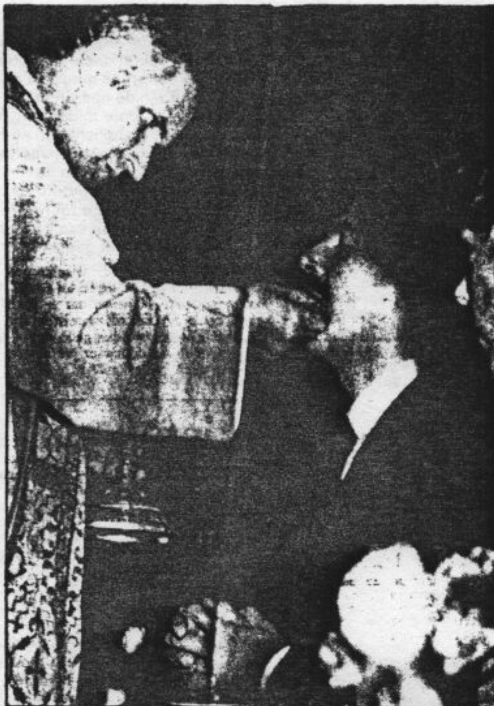
Het voorbehouden van communie aan alleen kerkelijk getrouwde gelovigen is volgens bisschop Gijsen geen teken van onbarmhartigheid, maar een verdediging van liefde en trouw.

Dat is te veel gevraagd van het echtpaar. Zij zijn uitgeweken naar een andere kerk. In een bisdom met twee gescheiden katholieke kerken hoeft je daar niet lang naar te zoeken.