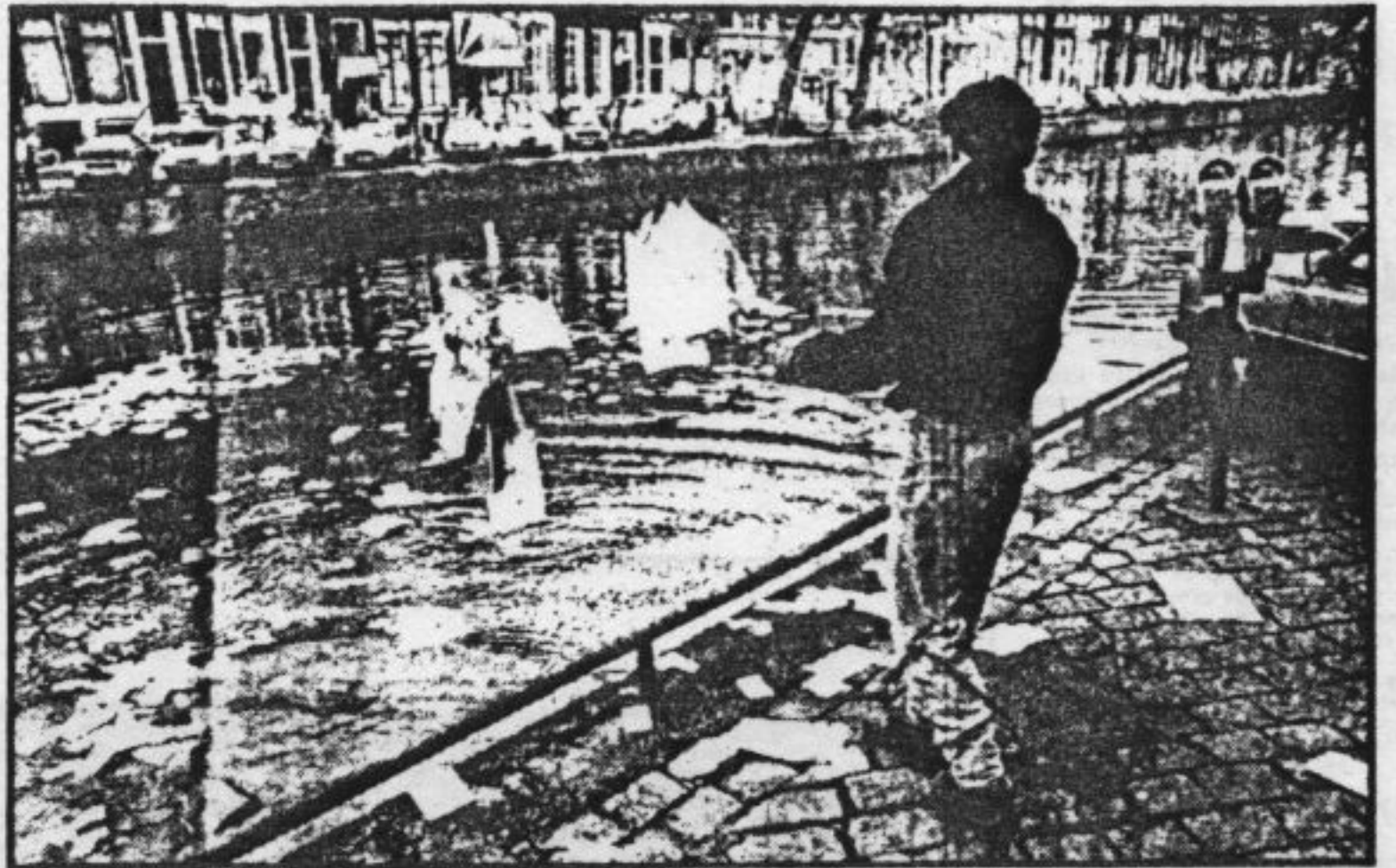
In augustus 1985 hebben actievoerders boeken en documentatiemateriaal van de bibliotheek van de Nederlands-Zuidafrikaanse vereniging te Amsterdam in de gracht gegooid.

Dat de instanties in Veenendaal een publieke verbranding niet toestaan is een andere zaak. Waar het hier om gaat is dat drs. Dorenbos en de zijnen een aantal geschriften zedenbederfend vinden en als zodanig in strijd met de wil Gods. Zij gaan ervanuit dat bedoelde geschriften porno bevatten en dat