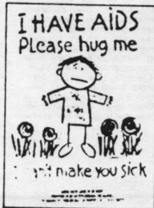
Een poster die het droevig lot van de AIDS-kinderen illustreert. «Aspblieh, knuffel mij, ik kan je niet ziek maken.»