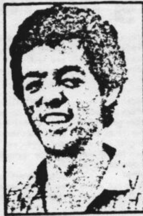
Links Da Silva als filmster Pixote, rechts als zichzelf in 1984.