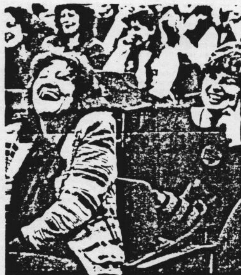
BIJENKOMST VAN Rooie Vrouwen in Utrecht in 1980 over de termijn aan de orde zijnde wet op de seksdiscriminatie. Zullen er veel van zich laten horen?

den (kunnen) gemaakt en voorzover nodig moeten die uitzonderingen in de wet zelf staan omschreven. Vage en voor meerdere uitleg vatbare formuleringen dienen te worden vermeden. Die roepen alleen maar interpretatieproblemen op. Dit uitgangspunt wordt in het bijzonder gevolgd waar het gaat om het probleem van de botsing van grondrechten het grondrecht van gelijke behandeling tegenover het (klassieke) grondrecht van vrijheid van godsdienst in combinatie met de vrijheid van onderwijs. Het probleem is bekend: mag een bijzondere school op christelijke grondslag een homo- of heteroseksueel of een ongehuwd samenwonende als leerkracht met een beroep op die twee grond-