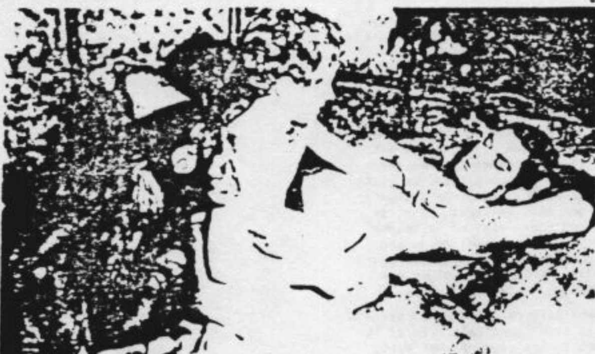
Levens in Brusselse groep CRIES zimpetjes in een internationaal pedofiliestudie. Ze hebben hun namen willen uitroepen, maar zijn nu in de cel en een aantal kinderen hebben de tralies.