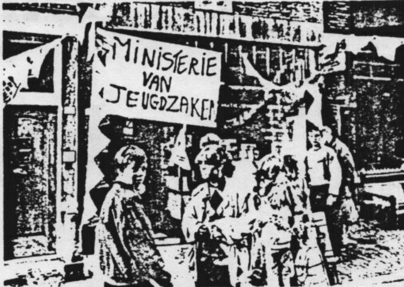
VORIG JAAR OKTOBER opende Komitee Kindervuist het Ministerie voor Jeugdzaken aan de Oudegracht in Utrecht. Wat er nu met het pand gaat gebeuren is nog niet bekend.