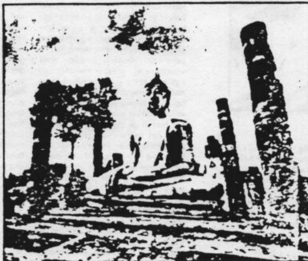
■ Een immens beeld van Boeddha in Thailand

Op conferenties, seminars en in forumsdiscussies is het toerismebeleid het afgelopen jaar uitgebreid besproken. Aids dook telkens weer op als het meest acute probleem. Naar schatting een derde van de toeristen komt louter en alleen voor het nachtleven in de hoofdstad. Er zijn al tekenen dat mensen het land niet