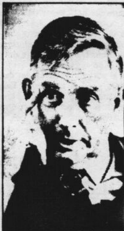
Minister Korthals Altes

missies waar klachten kunnen worden gedeponereerd, onderzoek kan worden verricht naar oorzaken en achtergronden van ongelijke behandeling en gerichte positieve actie kan worden ondernomen, blijft een Wet gelijke behandeling grotendeels een symbolische wet.