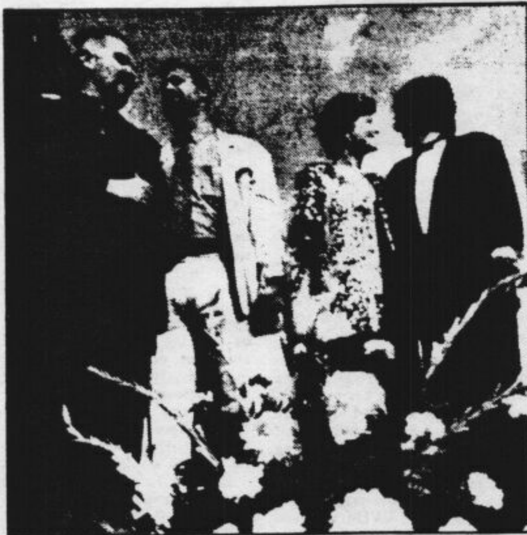
Een mannelijk en een vrouwelijk „echtpaar” poseren in Washington. Zij maakten deel uit van een massale „trouwpartij” in het kader van de mars op Washington van homo's en lesbiennes.

Een man uit New York stapte de bus uit om zich in de betogersstoet te begeven en ging prompt door de knieën: aids in een laatste stadium, meldde het ziekenhuis later op de dag. En als deze man al niet de toon zette dan deden dat in elk geval de honderden mannen die zich vooraan in de stoet per rolstoel voort-