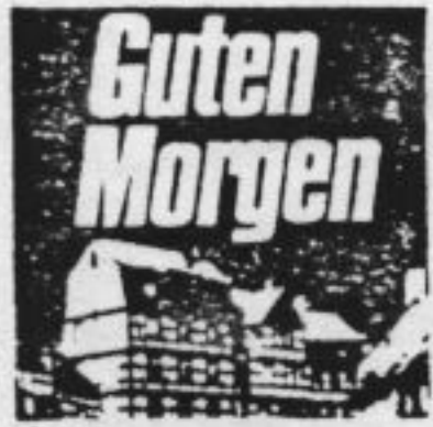
door Hetty Hessels

„De mens kan lachen“, schrijft de 9-jarige Benno, „dat kunnen dieren niet. Die kunnen hoogstens met hun staart kwispelen.“ In de menselijke creativiteit ziet Paul (10) ons wezenlijkste kenmerk. Zonen schaduwzijde zijn ook in de wereld van de kinderen naaste burens.