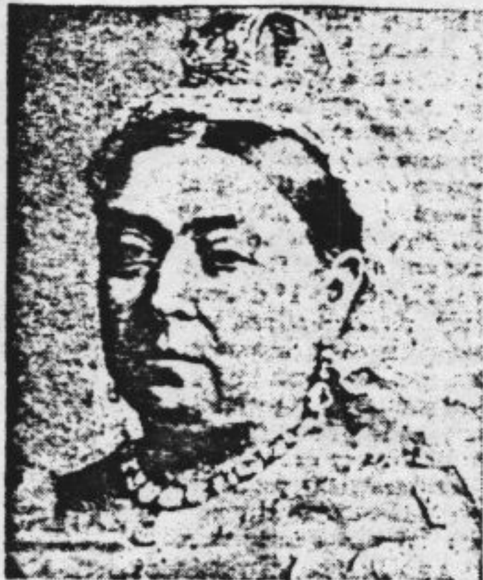
Koningin Victoria, die haar naam aan het tijdperk van - vaak vermeende - ingetogenheid gaf

IN het spraakgebruik staat de kwalificatie 'Victoriaans' gelijk aan 'preuts'. De regeringsperiode van koningin Victoria (1837-1901) zou gekenmerkt zijn geweest door een grote ingetogenheid op seksueel gebied, vooral bij vrouwen. 'Op je rug liggen en aan Engeland denken', was zo'n beetje alles wat meisjes aan seksuele voorlichting kregen als ze op het punt stonden in het huwelijk te treden. Afbeeldingen van menselijk naakt, ook al ging het om grote kunstwerken, werden zorgvuldig aan het oog onttrokken en zelfs de poten van meubels verdwenen achter zedige rokjes om maar niemand op slechte gedachten te brengen. Het Victoriaanse huwelijksleven was koud en frigide, als gevolg waarvan menige echtgenoot troost zocht bij prostituées en maitresses. De onderdanen van Victoria moesten op seksueel gebied kreupel zijn geweest, ernstig misvormd door een rechtlijnige moraal waarin geen plaats was voor lust of plezier.