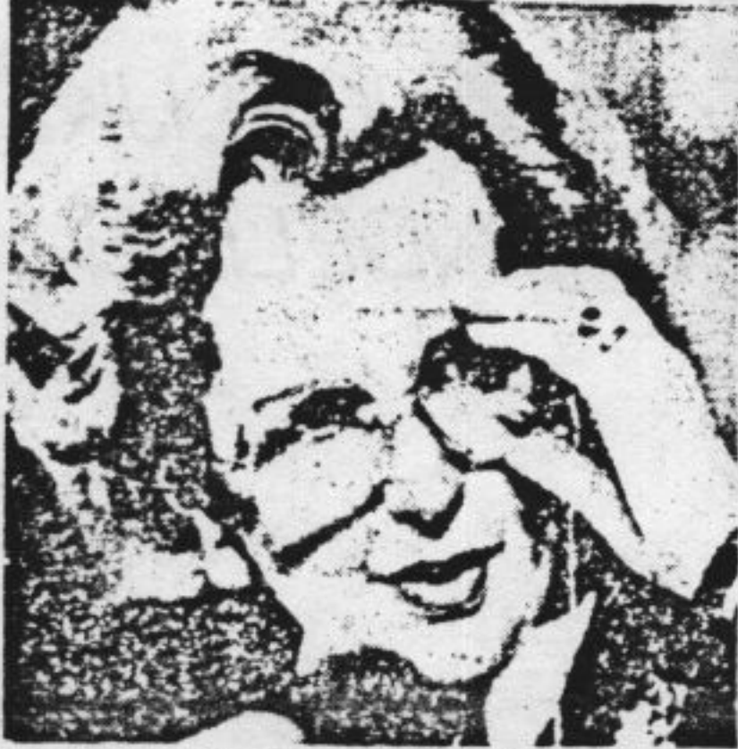
Bij Margaret Thatcher staan de Victoriaanse waarden in hoog aanzien, maar niet bij haar alleen