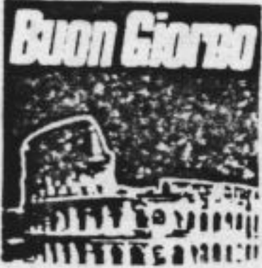
door Gaither Stewart

Het veld overziende, voorspelt Giusti daarom een schone toekomst voor de Nieuwe Romantiek.