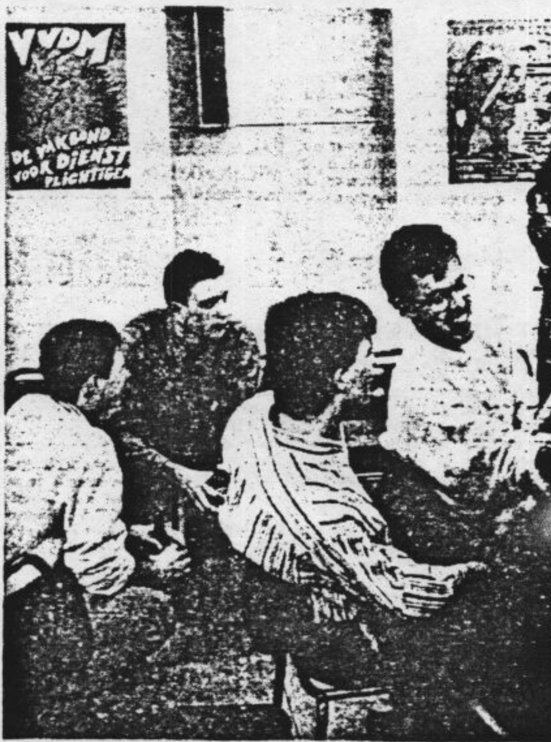
Dienstplichtigen bespreken in de Hojel-kazerne de problemen van homoseksualiteit in de krijgsmacht. Op de achtergrond de affiche die in de meeste kazernes niet lang de muren heeft mogen sieren.

„Zo heb ik m'n homo-zijn meteen maar duidelijk getaleerd. Ik heb ze ook laten weten dat ik me niet, zoals sommige andere jongens, zou laten wegpesten maar ze meteen op hun smool zou timmeren. Uiteindelijk krijgen ze dan toch respect voor je. Daarom kan ik nu zeggen dat ik tot nu toe een fijne diensttijd heb gehad met zelfs een aantal leuke relaties. Ik ga er van uit dat ik ben opgeleid voor de verdediging van het Nederlandse volk. Welnu, tien procent daarvan is homo.”