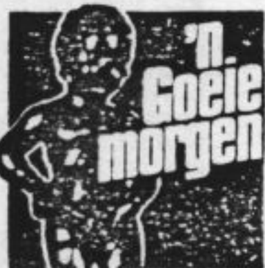
door Jan Schils

Van de 11-jarigen gaat 73 procent graag naar school; met 15 jaar is dat nog maar 63 procent. Dat laatste is verklaarbaar: van de 15-jarigen is tweederde minstens één keer blijven zitten.