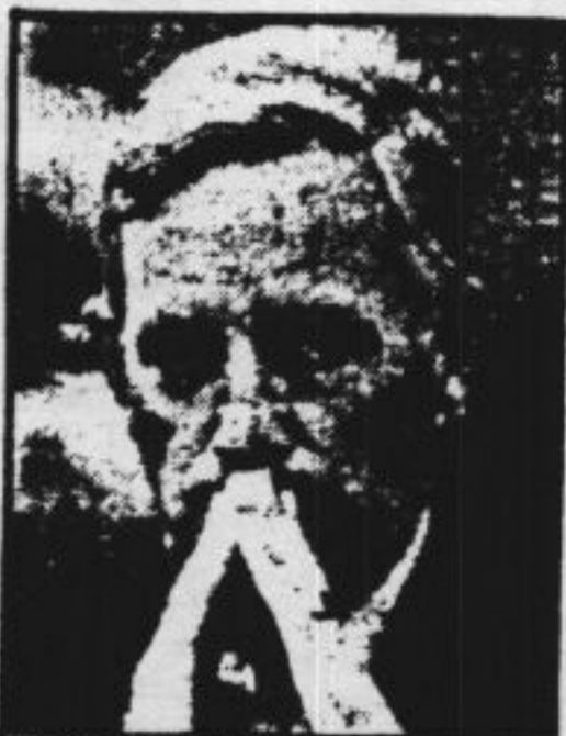
Minister Korthals Altes

Een ambtelijke werkgroep vond dat een te sterke beperking en pleitte voor een zogenaamde veiligheidsfouillering. Korthals Altes heeft daarover advies gevraagd van het Centraal politieberaad, de Vereniging van Nederlandse gemeenten en het openbaar ministerie. Ook de Tweede Kamer drong eerder