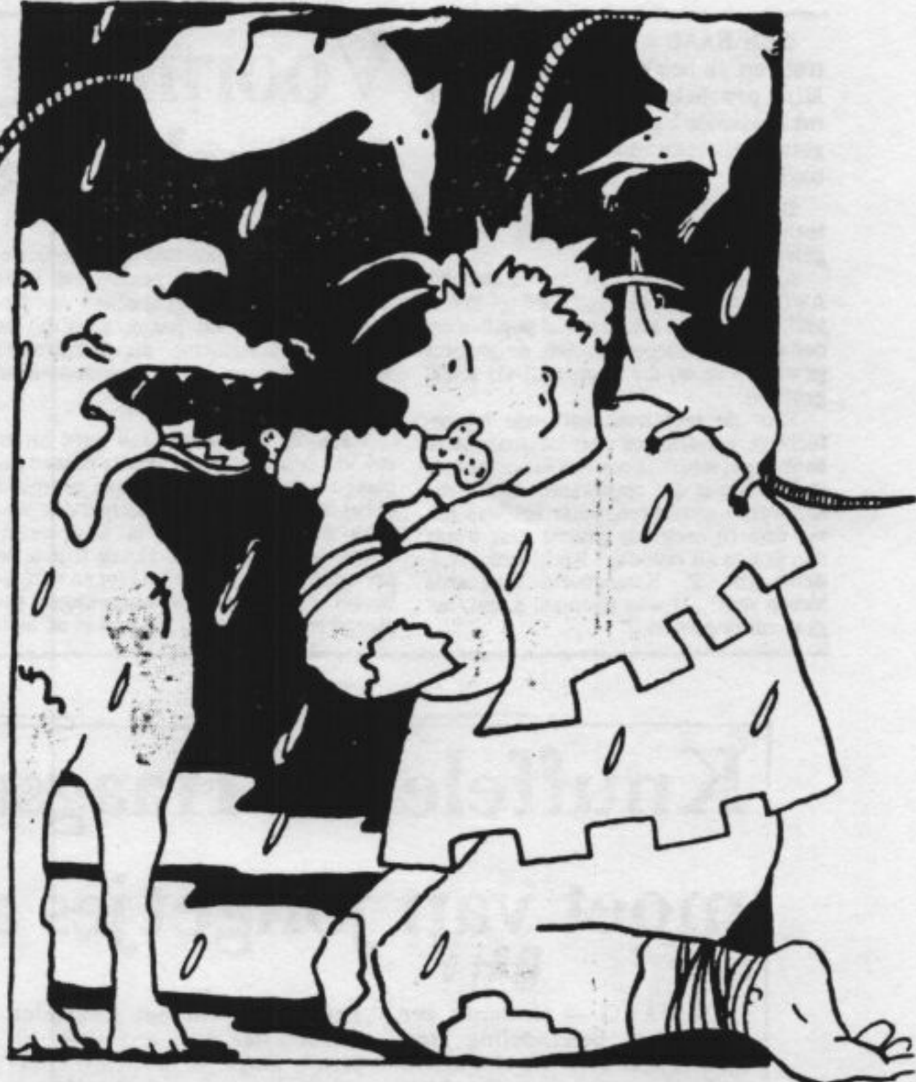
ILLUSTRATIE JOSÉ BLOKS

Kroll koos de donkere periode van de elfde eeuw en beperkte zich tot Engeland en het Frankische Rijk. Uit de geschriften die daarvan verslag doen werden ase-