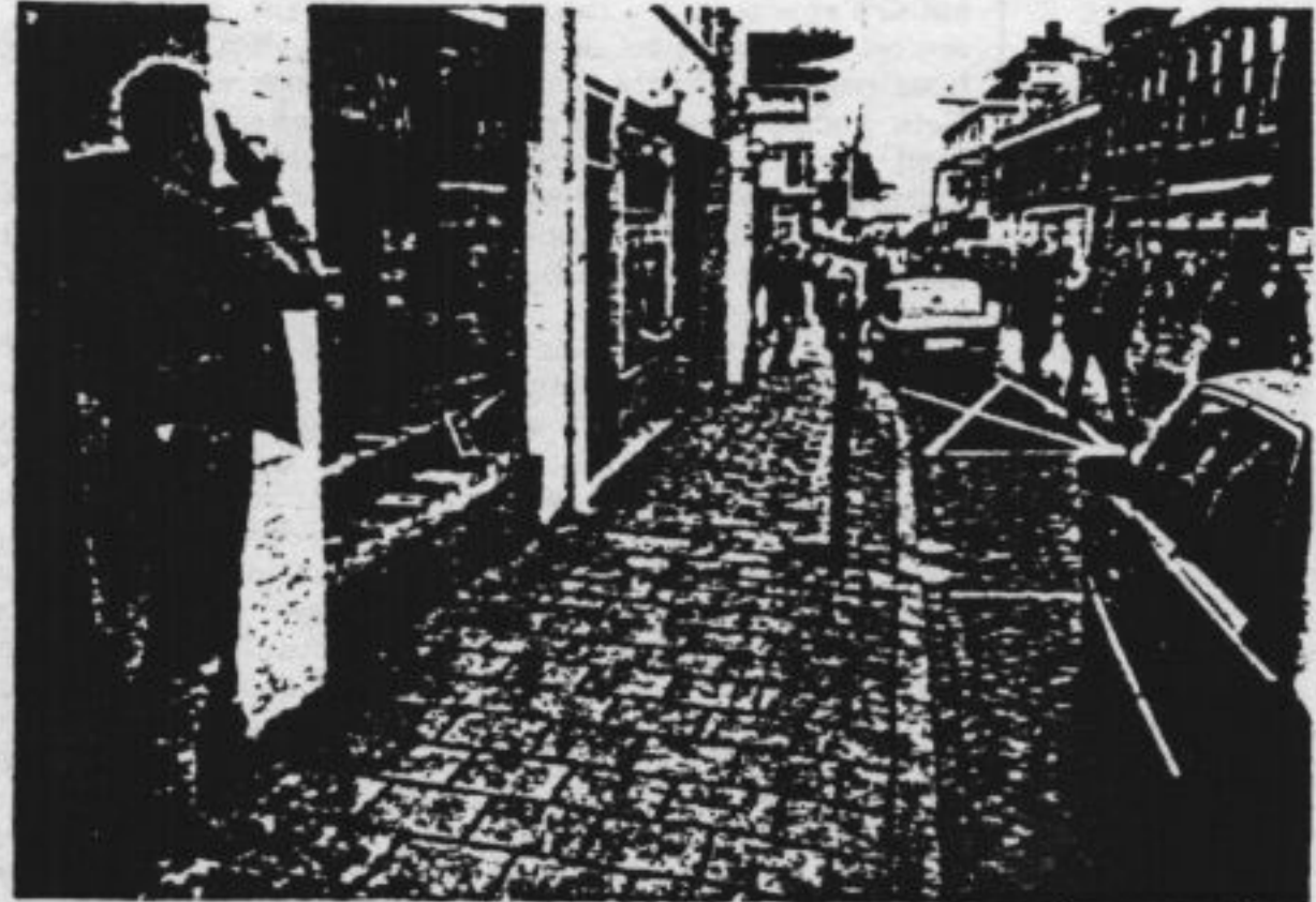
Nijmegen, juni 1984

Minister Korthals Altes is niet meer van het televisiescherm af te slaan. Bijna dagelijks is er wel wat te doen over de gang van de Nederlandse rechtsstaat. Nieuwe instructies voor schieten en fouilleren, overvolle