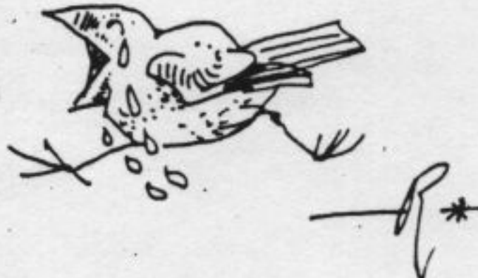
Tekeningen: Peter Vos

Op verzoek van de betrokkenen zijn de namen van de minderjarigen in dit stuk veranderd.