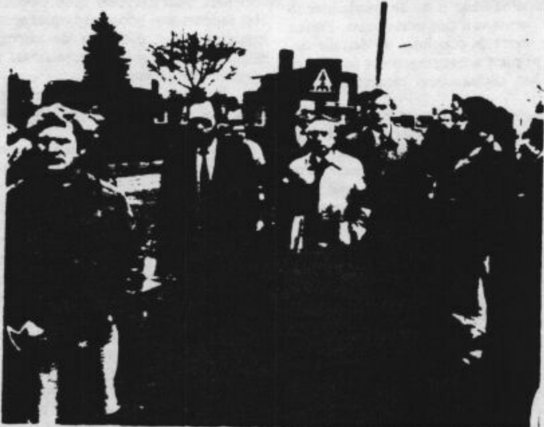
Minister Korthals Altes arriveert in Oude Pekela.

ken land. Toen hij zijn nieuwe eigendom van binnen ging bekijken, trof hij daar een curieuze verzameling achtergelaten rommel aan: fotorolletjes, injectiespuiten met naald, een doos waarin een videocamera verpakt was geweest, een