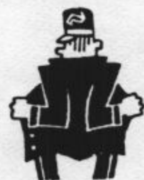
moet je zelf bewijzen dat je het

„Ik heb na het vertrek uit Den Bosch een minuut of wat op het balkon staan wachten tot de trein over de wisselstraat heen was. Dat was alles. Mijn broek was niet open, niets. Een collega vroeg: nog of ik soms een knoop aan mijn broek stond te naaien. Nee, ik heb zelfs niet gekrabb.” De ontslagen hoofdconductor die wordt beticht van „seksuele handelingen met zichzelf” heeft via zijn advocaat een oproep gedaan om getuigen te vinden die de aanklacht van een vrouw kunnen weerleggen. Volgens de hoofdconductor, die bijna tien jaar bij de NS werkt („er is nooit eerder een klacht gekomen”), heeft de NS andere redenen om hem te ontslaan.