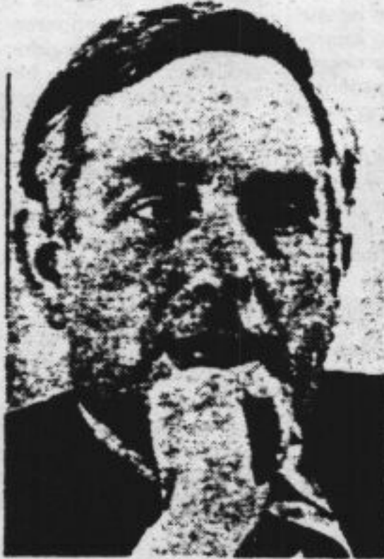
Minister Korthals Altes

Maar er is nog een andere reden waarom men mag twifelen of de