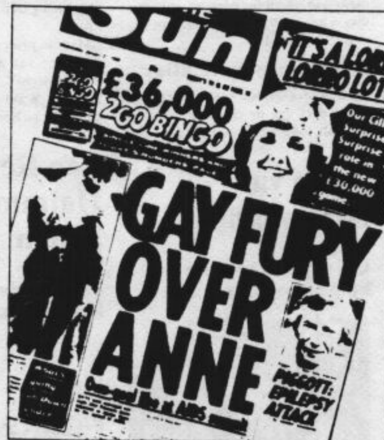
The Sun van 27 januari 1988

"Buckingham Palace mag zich dan door de idioterie laten meeslepen, de regering doet daar zoals gezegd niet aan mee," stipuleert