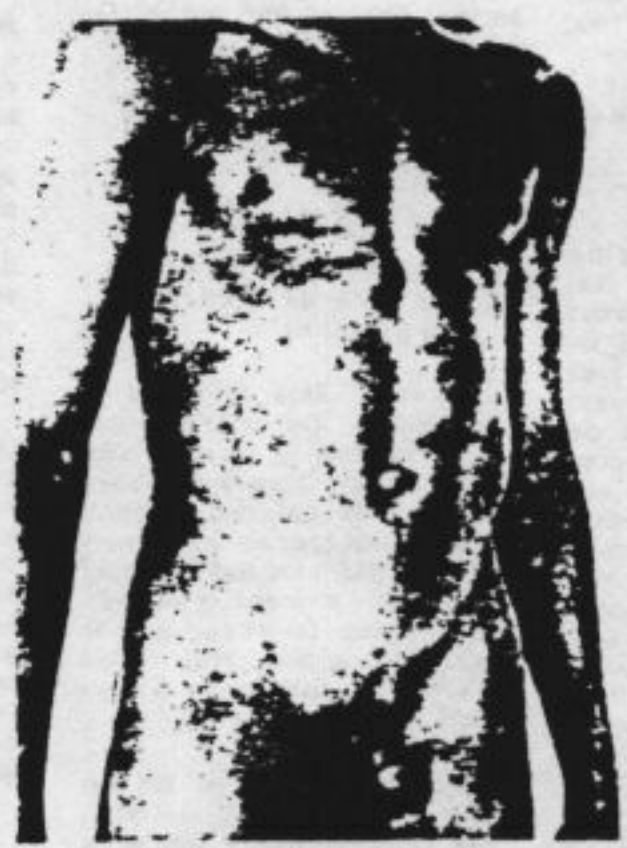
Niet in beslaggenomen

door hen gewenste richting bij te sturen. Bijna de helft van het eindrapport van de werkgroep in 1986 werd in beslag genomen door een reeks adviezen over de handhaving van artikel 240b, waar de minister in het geheel niet om gevraagd had. Een van die adviezen kwam neer op oprekking van de wet: alle afbeeldingen die kennelijk bedoeld zijn om seksueel te prikkelen, zouden moeten leiden tot strafvervolgung. Het 'voorterrein' mocht niet bij voorbaat worden prijsgegeven, aldus de werkgroep, die daarmee de uitspraken van de Kamer aan haar laars lapt. Daarnaast zou de opsporing van pedoseksuele contacten verscherpt moeten worden: onmiddellijke huiszoeking zou standaardpraktijk moeten worden, in de verwachting dat daardoor zo veel mogelijk privéfoto's (bewijsmateriaal!) verschalkt zouden kunnen worden.