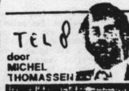
TELE door MICHEL THOMASSEN

DEN HAAG — Elke keer als in Frankrijk, Groot-Brittannië of de Verenigde Staten harde porno of kinderpornografie wordt gevonden, verklaren politie of politielid dat de smeerlapperij uit Nederland komt.