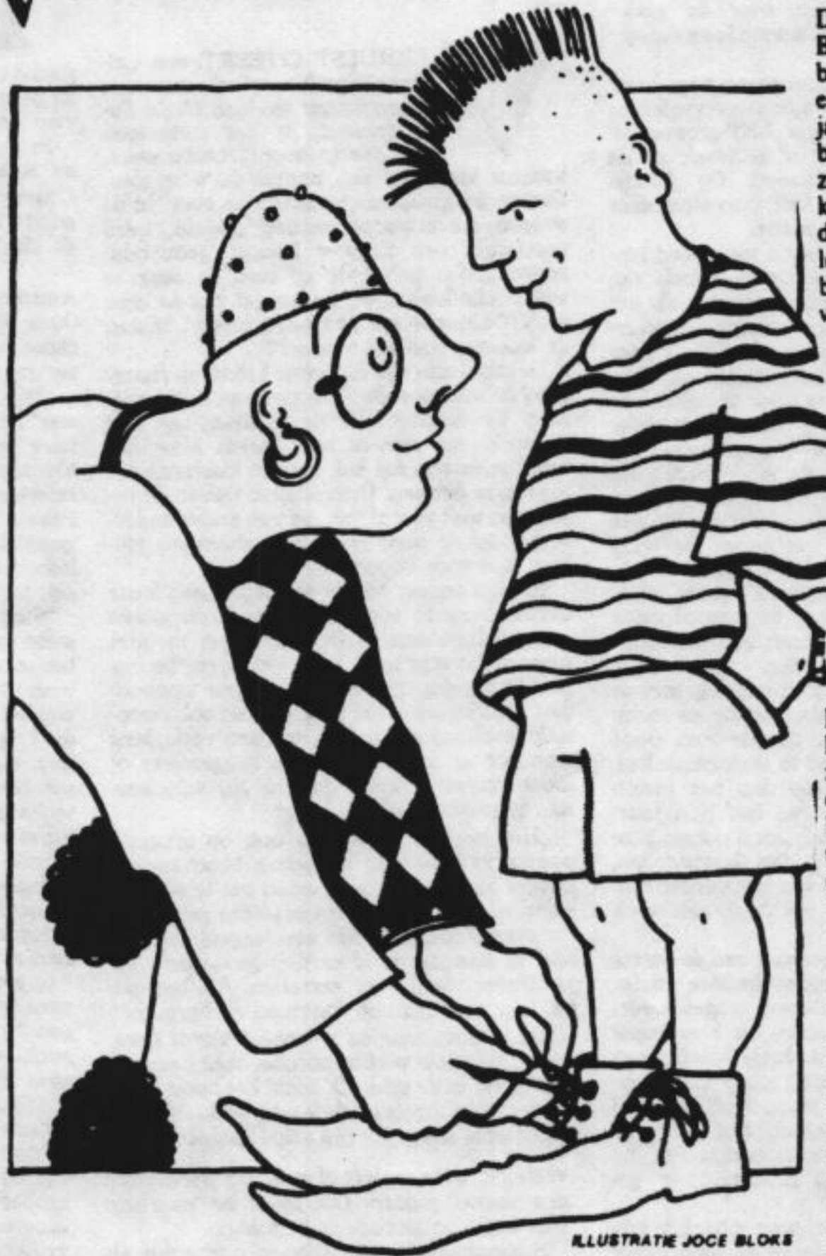
ILLUSTRATIE JOCE BLOK

D e clown-busje-ballonnen variant is al op veel manieren aangevochten. Men heeft daar geen psychologie voor nodig. Maar iets vanuit de psychologie toevoegen kan nog wel. Tijdens een radioprogramma over deze kwestie zei H.J.A. Hofland enigszins verwijtend tegen mij dat er te veel over de kinderen werd gesproken, zonder te letten op individuele verschillen. Het ging op dat moment over de verhalen die kinderen achteraf vertelden, toen de emoties in het dorp al welig tierden. Daarom was ik het niet helemaal met hem eens, want uit experimenten is gebleken dat bij moeilijke of emotionele onderwerpen en situaties kinderen in hetgeen ze zeggen naar elkaar toe trekken. Individuele verschillen komen minder tot gelding. Reden dus voor wie achter een waarheid wil komen om groeps- en kringgesprekken te vermijden. Daartegen is in Oude Pekela gezondigd. Hofland heeft echter wel gelijk als het gaat om het 'meegaan'. Als het gegaan is zoals men denkt, rook geen kind immers onraad bij het langkomen van het busje. Integendeel, het was een verleidelijk vrolijke boel. Dan hebben individuele verschillen hun kans. Als we ons houden aan het aantal van de artsen Jonker: in totaal 90 kinderen gedurende de Paasvakantie, dan moeten er op basis van psychologi-