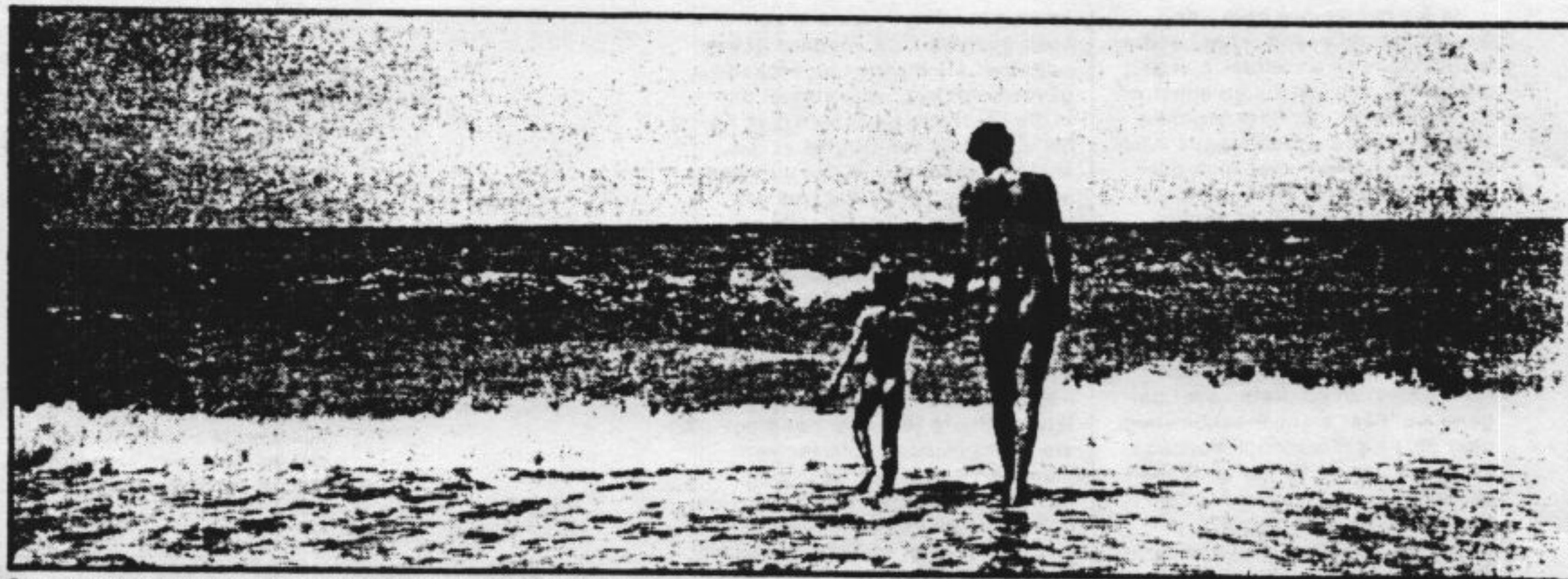
Ongemeen spannende bikini's ontbreken, evenals lui met biceps.

Op het blootstrand bestaat de dans niet, zoals ook al te innige omhelzingen worden vermeden. Men zou er maar iets van gaan denken. Dat heeft ook te maken met het gegeven dat de jongelui tussen de twaalf en twintig jaar vrijwel ontbre-