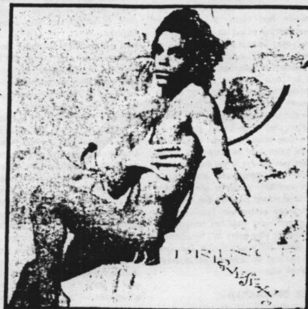
De gewaagde hoes van Prince's Love-Sexy LP.

De platenmaatschappij van Prince in de VS meent, dat de boycot nauwelijks effect