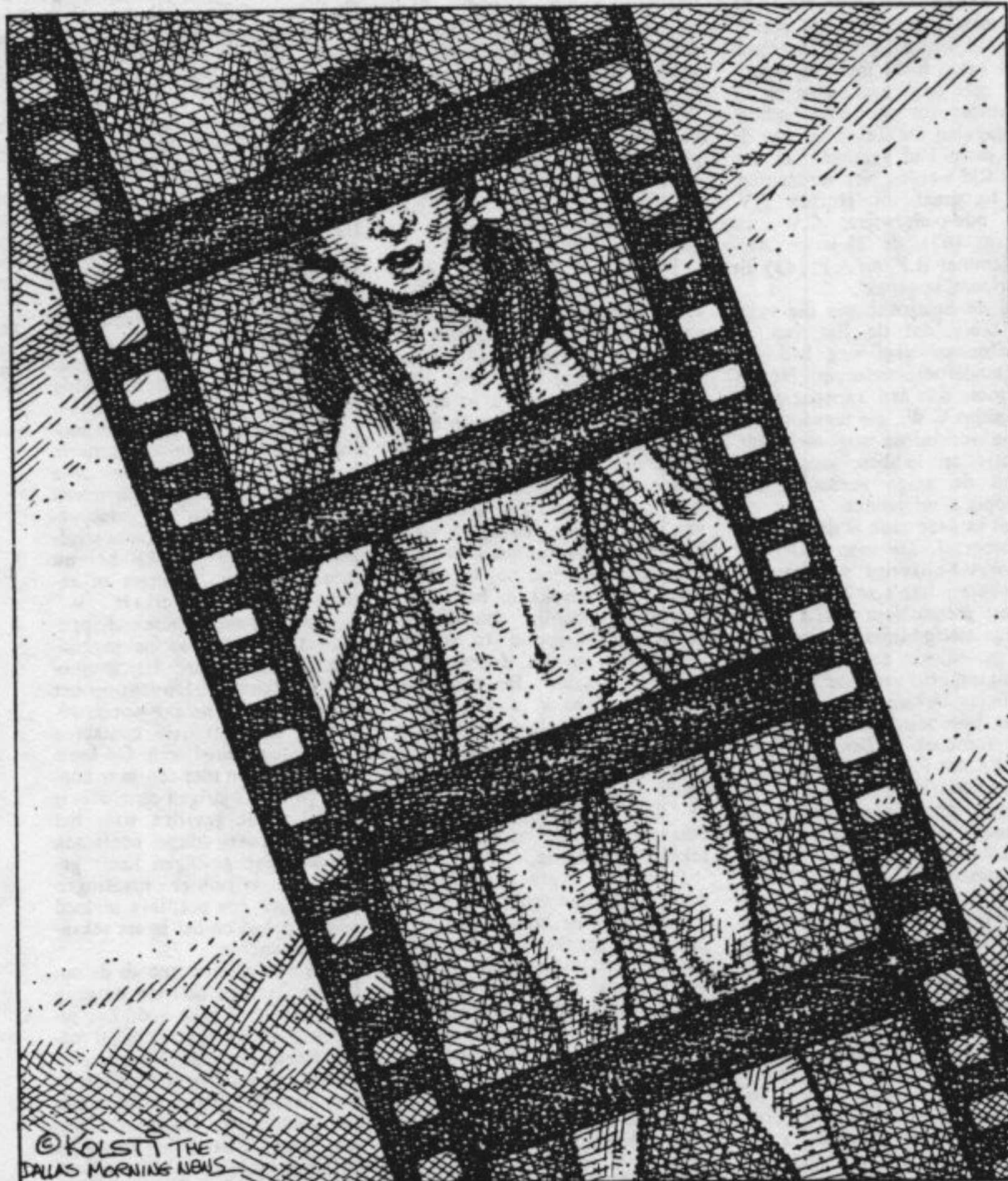
Gefilmde kind: zijn er sporen van angst op het gezicht te herkennen? (Tekening: Kolsti)

Daarbij is dus niet de veroorzakende kwetsuur in relatie tot het Nederlandse zedelijkheidsgevoel