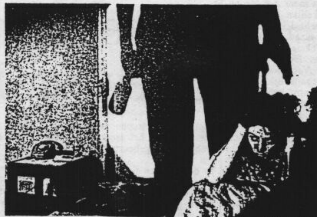
'Het bewijzen van de (on)wil van de vrouw is vrijwel altijd een onmogelijke opgave.'