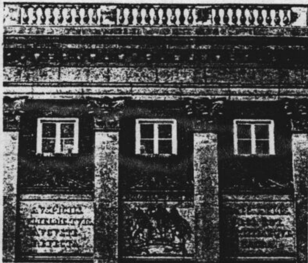
Paleis van Justitie Amsterdam

Andere therapeuten verkeren daarover dus helaas in onzekerheid en de gemeenschap is de mogelijkheid ontnomen de toetsstenen van het hof te beoordelen.