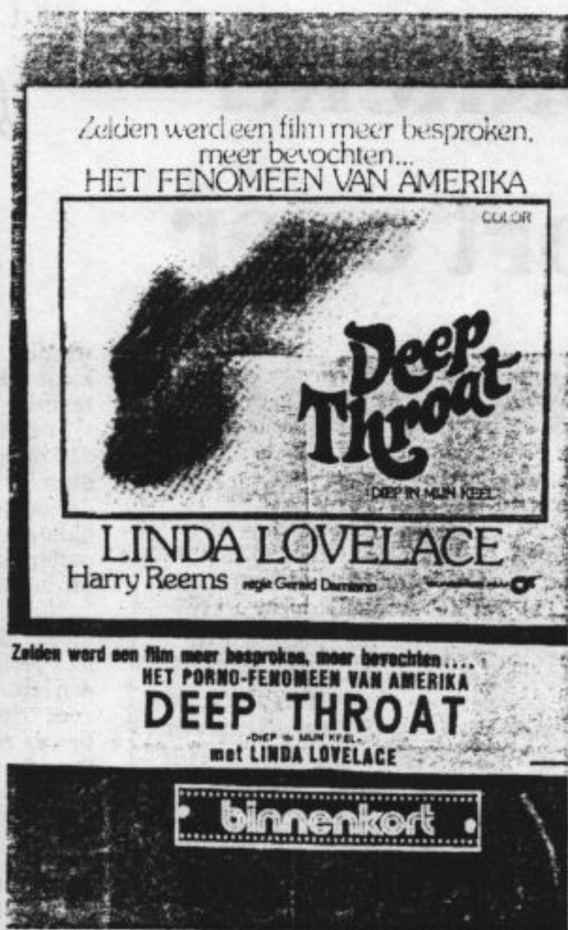
De vitrine van Cinecenter te Amsterdam

Het gebruikelijke pornopubliek was niet gediend van grappes, het wenste slechts in diepe ernst en opperste zwijzaamheid een reeks copulatie-scènes te aanschouwen. Gegrinnik in een porno-bioscoop is in strijd met de vereiste anonimiteit, geen van de bezoekers wil zijn aanwezigheid in zo'n zaaltje kenbaar maken. Deep throat bevatte echter enkele komisch bedoelde dialoogzinnen, zoals die van de geheel geklede man (gespeeld door de regisseur) die zich tijdens een orgie tot één van de copulerende mannen richt met de woorden: „What's a nice boy like you doing in a girl like that?” Linda Lovelace, die voor haar werkzaamheden 1200 dollar had ontvangen, verwierf nationale en later ook internationale roem. Zij bouwde als enige van de cast in het genre echter geen carrière op; volgens haar latere verklaringen had ze alles onder dwang gedaan. Ze trouwde later met een nette echtgenoot, stichtte een