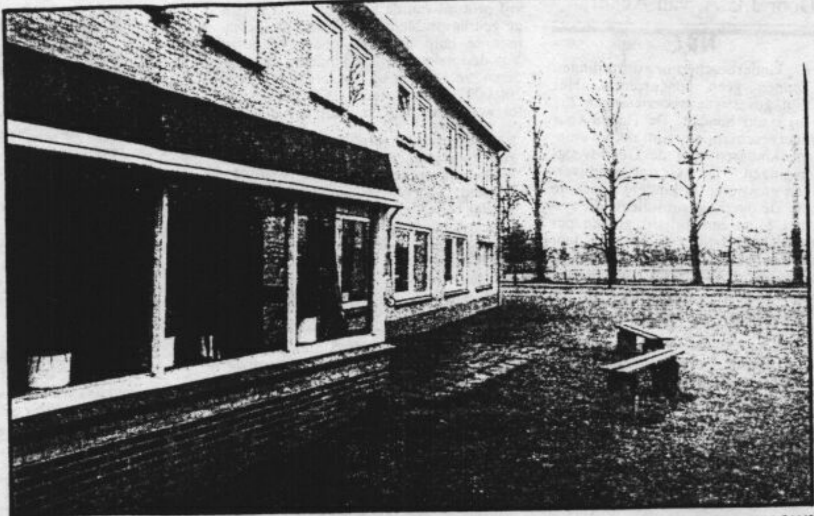
De Helderlingstichtingen te Zetten.

Hij kon daardoor geen mensen om zich heen verzamelen ten opzichte van wie hij zijn handelen kon toetsen. Hij kreeg geen feedback en maakte dat zelf ook niet mogelijk. Evenmin kon hij leiding geven aan ideeën van medewerkers om de situatie van de pupillen meer leefbaar en open te maken. Ik was indertijd misschien wel lastig voor hem met mijn kritiek op de behandelingsmethoden, maar hij ging er op geen enkele manier op in. In plaats daarvan verklaarde hij mij voor gek (Haagse Post 1-6-74). Belangrijker was echter dat hij de dialoog met de pupillen niet aan kon gaan. Hij keek hen niet aan als hij met hen praatte, verdiepte zich niet echt in wat hen bewoog. Veel kinderen voelden zich niet op hun gemak bij hem of waren bang. Dat is ook niet zo verwonderlijk gezien zijn negatieve kijk op de meisjes: „Het is puin; het zijn lege hulzen waar je alles in moet stoppen; voor deze meisjes gelden andere normen“.