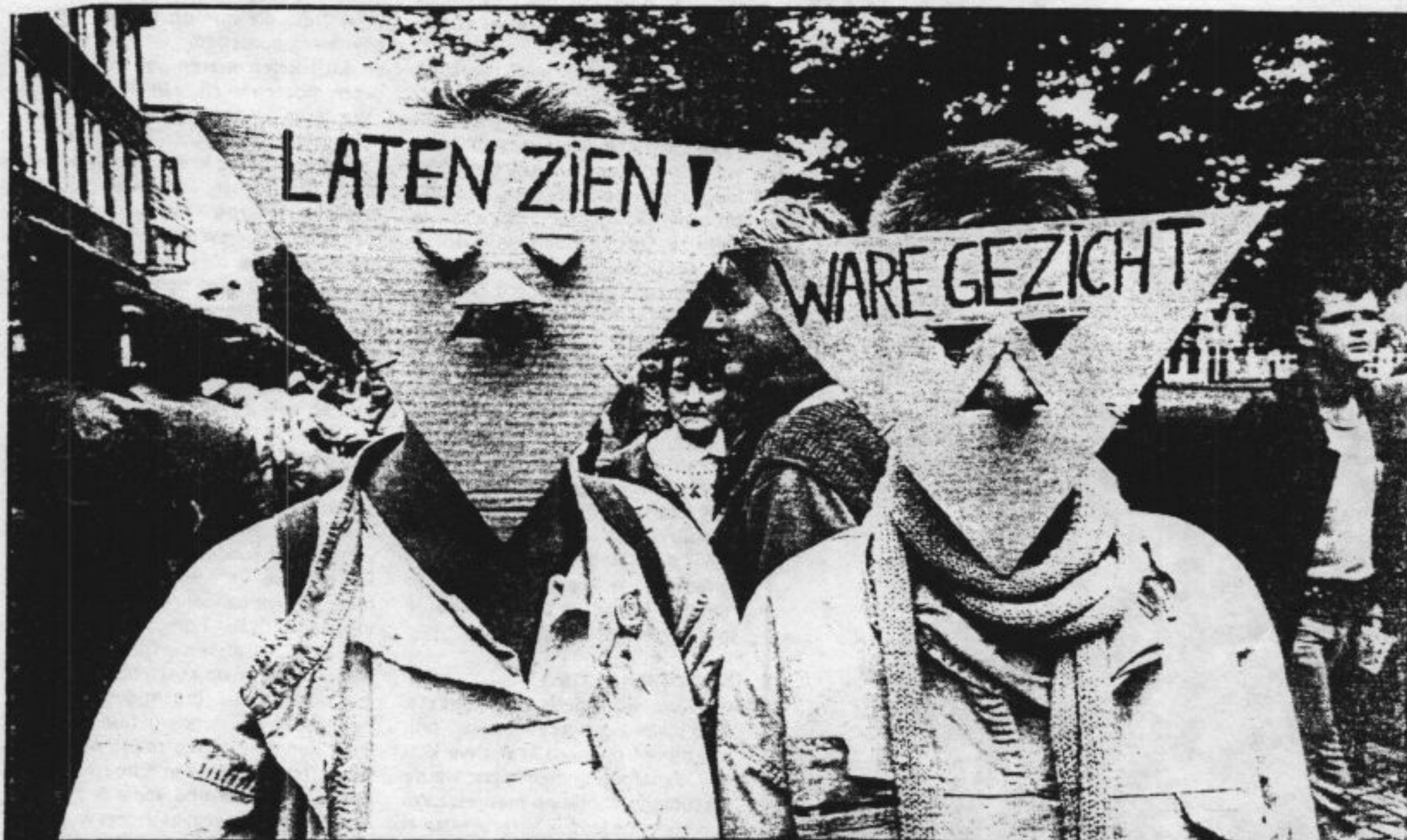
Meisjes op homodemonstratie: ware gezicht blijft verborgen achter masker