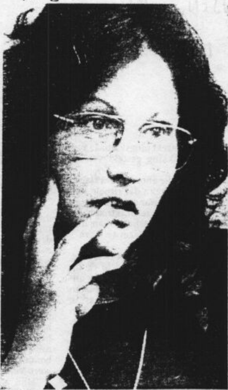
Linda Boreman, alias Linda Lovelace