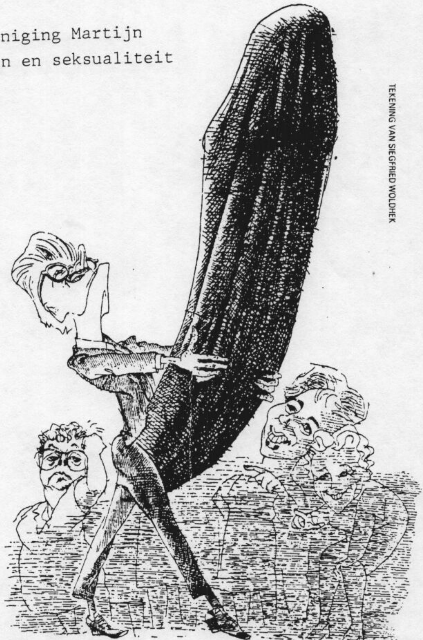
TEKENING VAN SIEGFRIED WOLDHEK