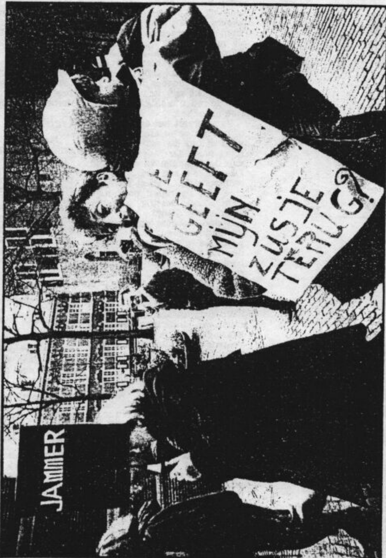
Betoging in Den Haag tegen het beleid van de kinderbewaking. Deze actie werd begin vorig jaar gehouden.

Maar hij kan zich goed voorstellen dat er verzet begint te rijzen tegen die combinatie van functies. „Ik heb er begrip voor dat steeds meer mensen zeggen: ik wil niet te maken hebben met een kinderrecht die als manager van de hulpverlening optreedt, ik heb liever een rechtsbeschermer, die mij tegen