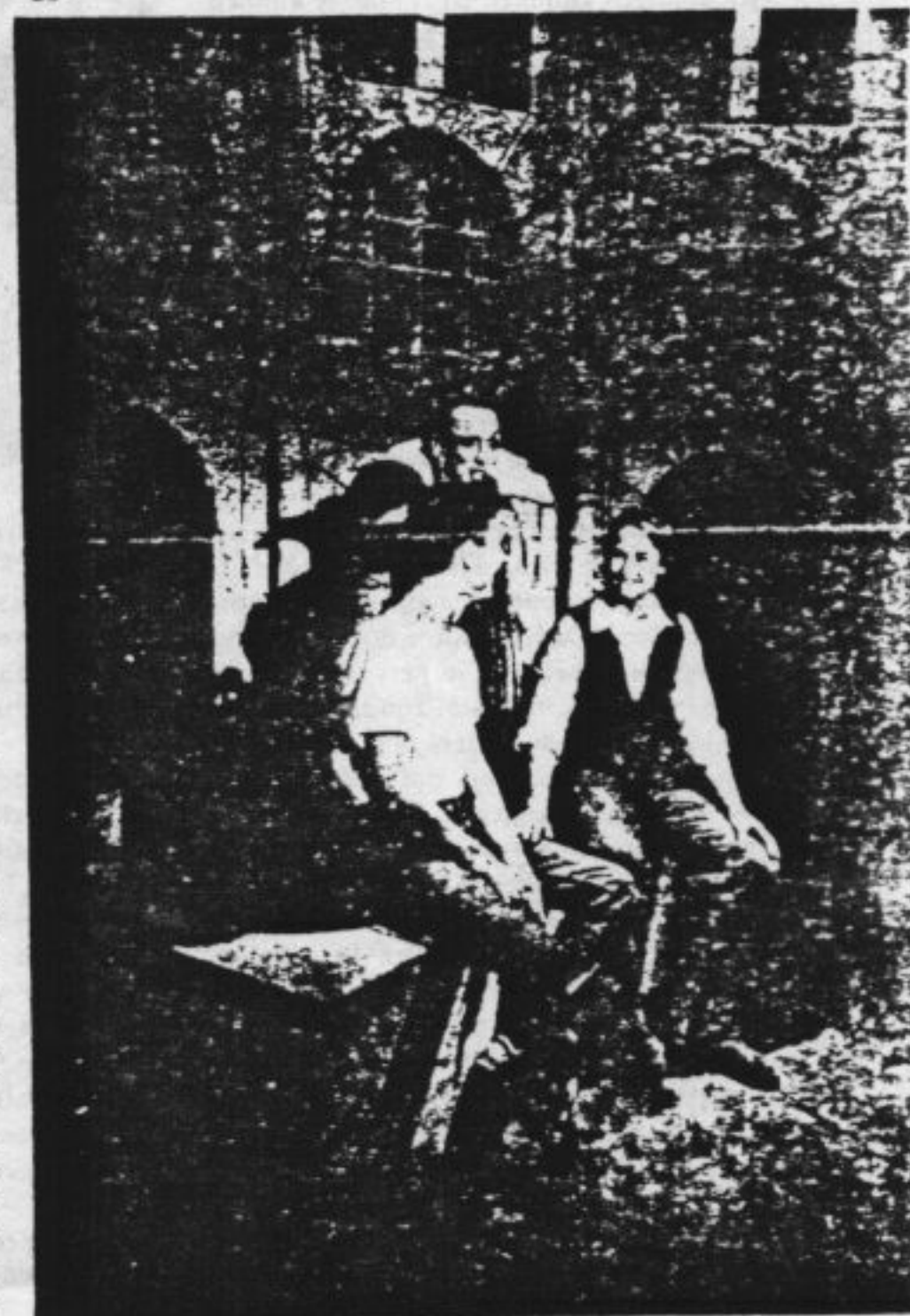
Kandidaten bij de Gay Dating Show.