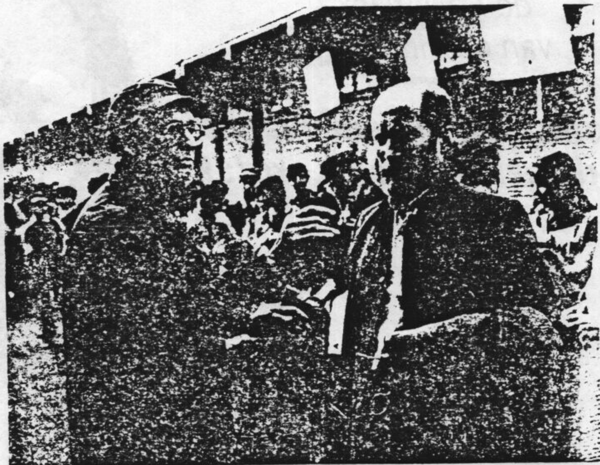
Regisseur Wajda met hoofdrolspeler Wojtek Pszoniak

is hoe dan ook een legende geworden in Polen. Zijn naam staat als enige met die van de kinderen gegrift in een herdenkingssteen in Treblinka. En in Israël heeft een kibboets een speciale ruimte aan hem gewijd, het Huis van de Gettostrijders.