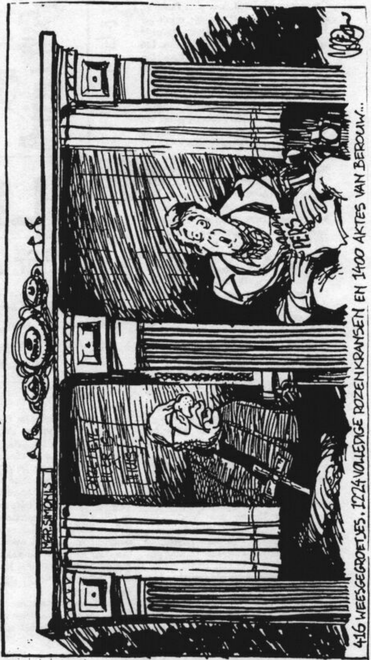
416 WEESGROETJES, 1224 VOLLEDIGE ROZENKRANSEN EN 1400 AKTES VAN BEROUW...