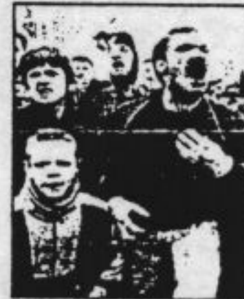
Backlash from Bootle

The murder of James Bulger is as ghastly a story as can be imagined. Yet it is a freak. The murder of a small child by a stranger, rather than by a parent or step-parent, is exceedingly rare: there have been ten such deaths in the past decade. This case is nothing to do with a trend in child-murdering. Nor is it obviously to do with a rise in youth crime. In England and Wales convictions or formal cautions to those under the age of 18 peaked in 1985 at 264,000 and dropped to 182,500 in 1991. Yet somehow the case has crystallised an amorphous national sense of unease into rage over delinquent children.