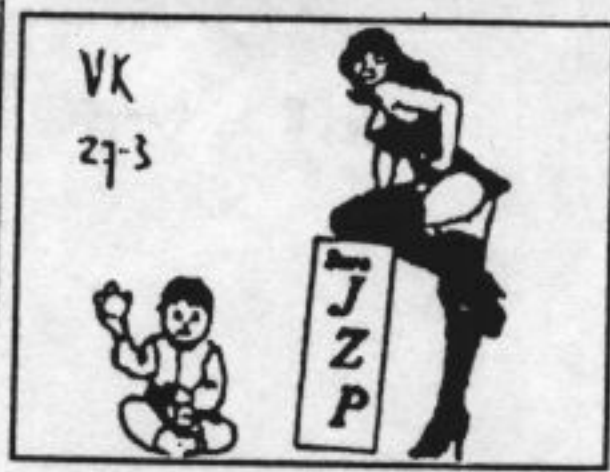
Faxlogo van het Buro Jeugd- en Zedenpolitie Amsterdam.