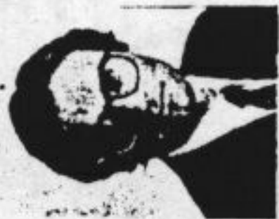
door René Diekstra

Op de vierde plaats tenslotte draait het om het vermogen 'proces-gericht' in plaats van direct 'oplossings-gericht' te ageren. Wat met dit laatste precies wordt bedoeld, kan ik het best illustreren aan de hand van een voorbeeld uit het werk van wijlen Halm Ginnott, kinderpsycholoog en een genie op het terrein van ouder-kind-communicatie. In zijn boek 'Tussen Ouder en Tiener' beschrijft hij de volgende vader-zoon dialoog: David, zeventien jaar oud, had gesolliciteerd