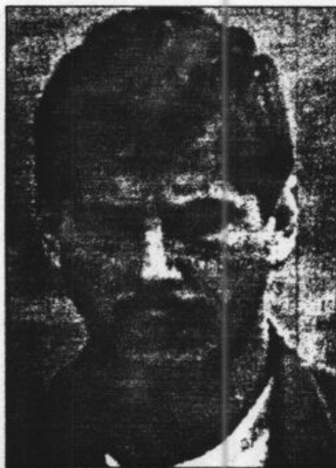
Hoofdverdachte Marc Dutroux... ontkent moorden...

De toeschouwers waren nauwelijks nog in bedwang te houden toen Dutroux zijn woning werd binnengevoerd om aan te wijzen waar gevangen moest worden. Een doodse stilte ontstond toen twee lijkwagens de straat inreden en duidelijk werd dat de lichaampjes van Julie Lejeune (8) en Mélissa Russo (8) waren gevonden.