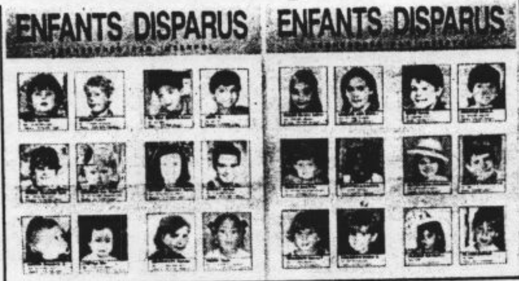
Plakkaats in België tonen de foto's van kinderen die worden vermist in Europa en worden gezocht door Interpol.

Volgens procureur des konings Bourlet heeft de zoektocht naar deze meisjes, die vorig jaar tijdens een vakantie aan zee verdwenen, nu absolute voorrang. Gezien de leeftijd (17