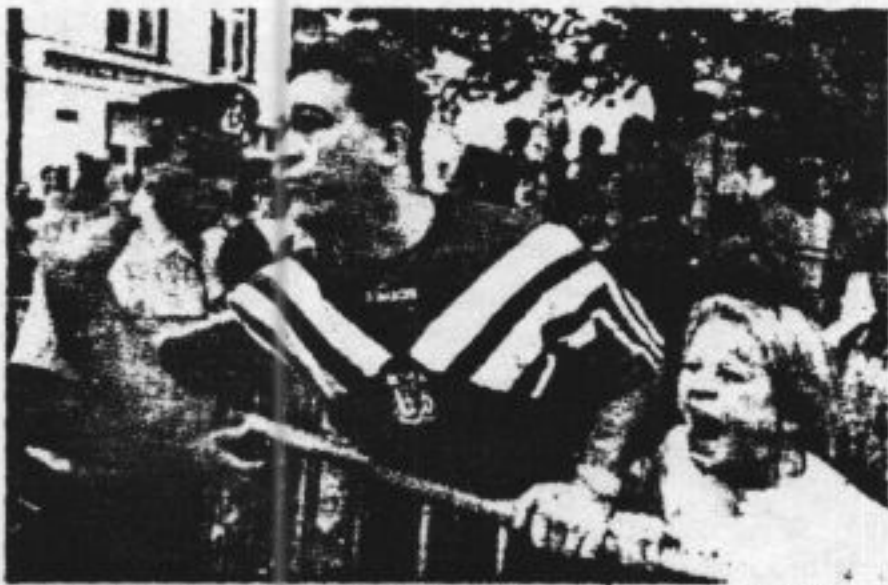
„Ter dood!" Bij het justiepaleis van Neufchâteau wacht een menigte Marc Dutroux op

geen profet". Wel hoopt hij dat de nu gewekte aandacht zich niet alleen zal vertalen in maatregelen op het repressieve vlak, maar ook op het preventieve — op school en in de gezinnen. Ook wenst hij dat niet alleen de politiek ter verantwoording wordt geroepen. „Ik hoop dat de last van de bekeering niet helemaal wordt afgewenteld op hen die regeren. Maar dat men zegt: de staat en de maatschappij, dat zijn niet alleen de politici en de magistraten, maar dat zijn wij."