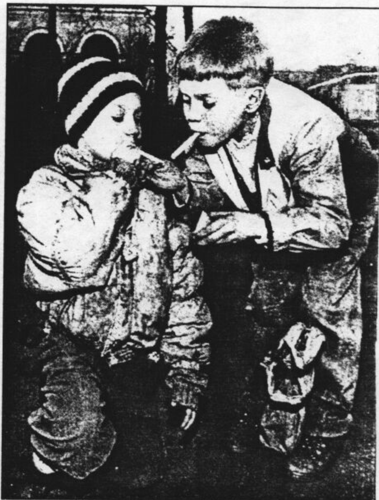
Zwerfkinderen in Sint-Petersburg

Een bekend verschijnsel bij een terugtrekkende overheid is de entree (of terugkeer) van liefdadige instellingen. Zo ook in Rusland waar sinds het opheffen van het verbod op particuliere charitas in 1988 maar liefst tienduizend liefdadigheidsinstellingen zijn geregistreerd, de helft daarvan ten behoeve van kinderen. Over de com-