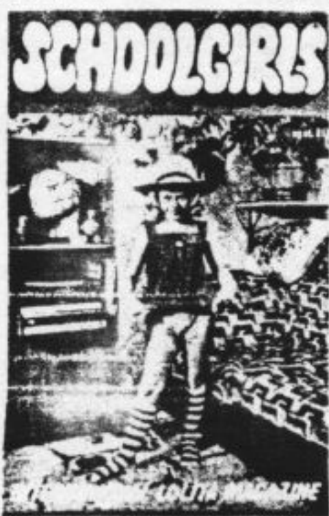
Tijdschrift met kinderporno Foto ABC

Ook hierin kreeg Oost-Europa een lesje marktwerking. De vraag uit vooral Duitsland, maar ook Oostenrijk, Denemarken en Nederland was groot, vooral naar speciale 'produkten' als jonge prostituees, meisjes en jongens, en pornovideo's met jongens. De produktiekosten van deze handelswaar waren in Tsjechië aanzienlijk lager dan in het Westen. Handige producenten en verkopers konden putten uit een ruim aanbod van jongeren die snel geld wilden verdienen om aan de grauwheid te ontsnappen en mee te kunnen doen in de nieuwe consumptierace. Het land grenst aan West-Europa en heeft daarmee het voordeel van korte distributielijnen. Deelstaten worden niet bijge-