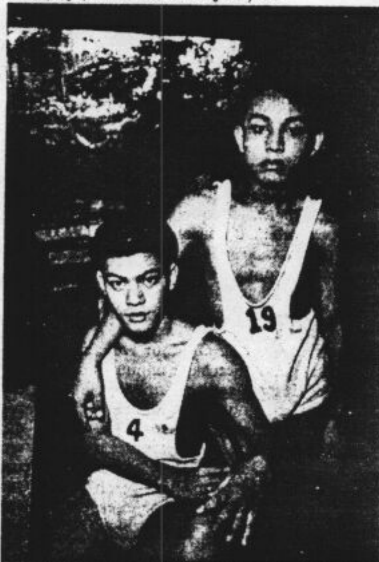
Minderjarige prostitutés

typhoons en permanent door armoede. Tijdens hun verhoor lachten ze niet veel los. Ze blijven volhouden dat ze 21 zijn.