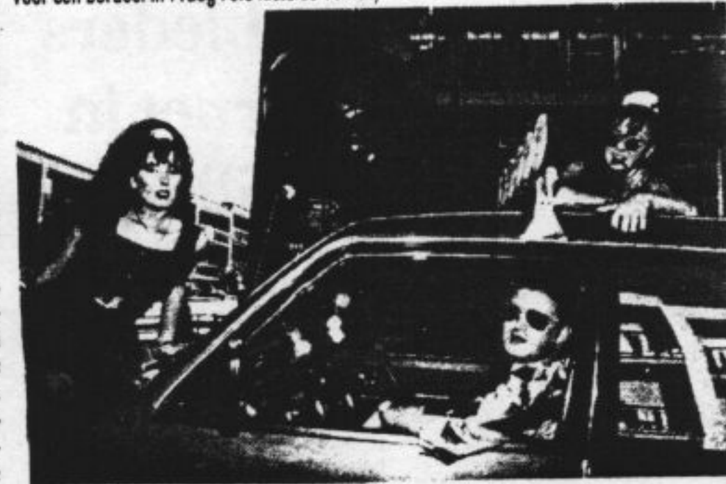
Voor een bordeel in Praag

leen in de kamer als er vlees op tafel staat?' Honden — meer zijn deze jongens niet voor de handel. Ik ben de eerste die werkelijk naar hen luistert. Misschien kan ik hun zo een uitweg bieden.“