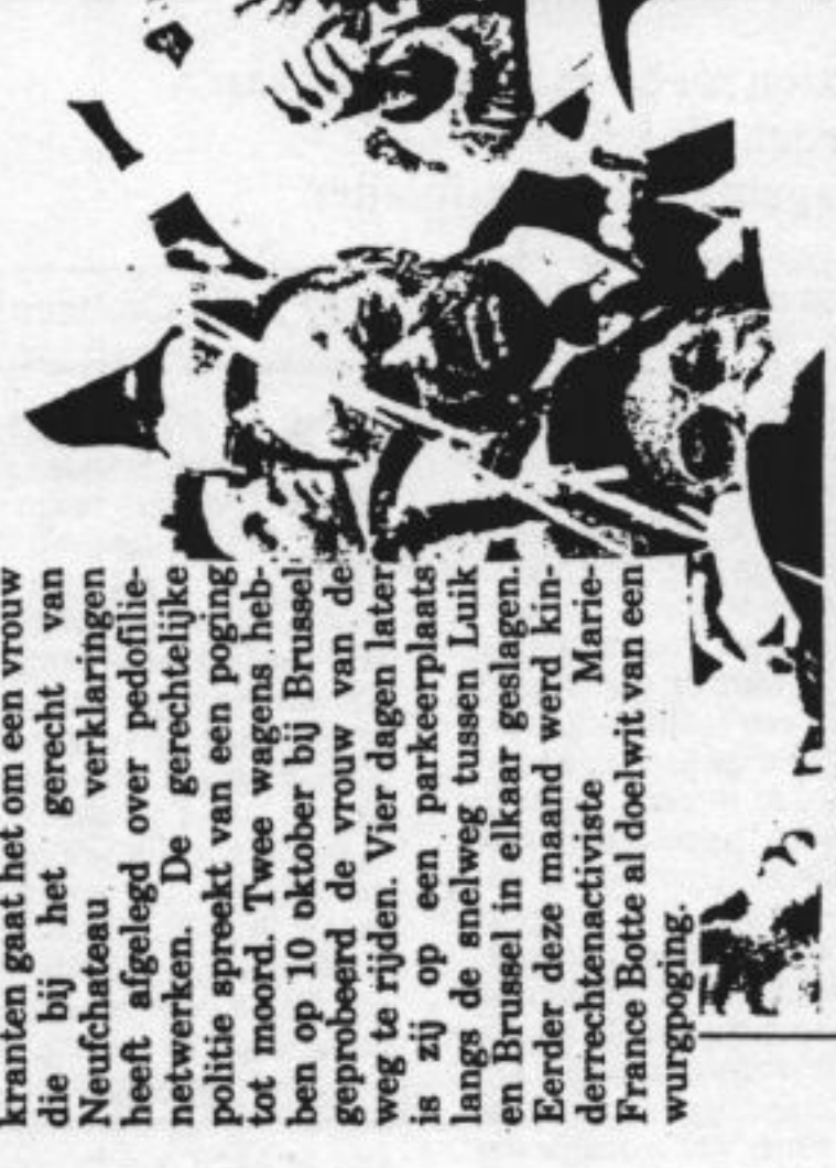
De betoging in Brussel was zowel een schreeuw om meer staaf als een oproep tot liquidatie van de machtshouders van dezezelfde staat