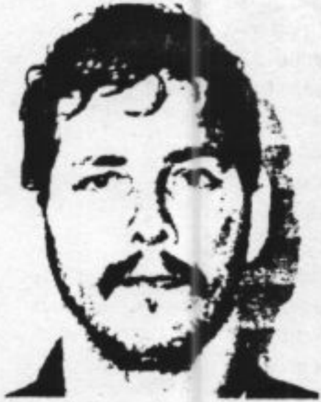
■ DUTROUX ... eerder actief ...

Volgens De Morgen beschikt het Openbaar Ministerie in het Zuid-Belgische Neufchâteau over getuigenissen die aangeven dat Nihoul en Dutroux al veel langer actief waren. Zo zou in 1984 een 16-jarig meisje uit Etterbeek, nabij Brussel, door Nihoul en Dutroux zijn verkracht en vermoord. Een niet nader genoemde vrouw zou aan