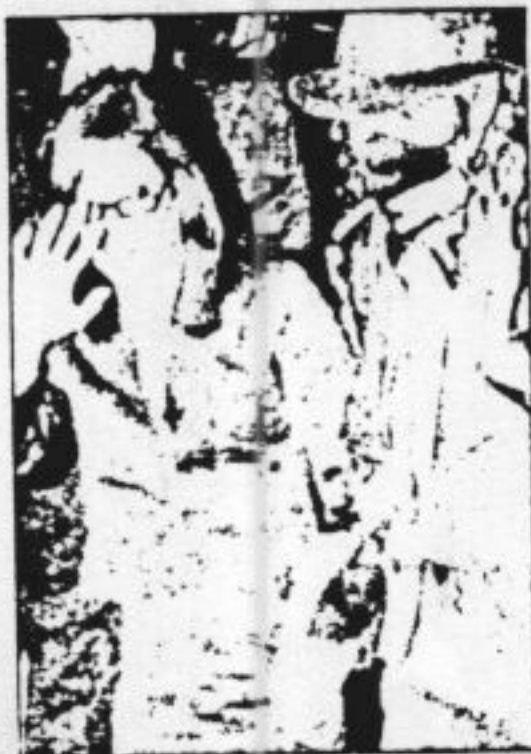
Michael Jackson met Lisa Marie Presley na een concert in het Wembley stadion.

Een verbijsterde LISA MARIE PRESLEY ontdekte dat haar voormalige echtgenoot MICHAEL JACKSON geobsedeerd was door jonge jongens toen zij een aantal schokkende seksvideo's in een van zijn kasten vond. Dit was voor haar de reden een einde te maken aan haar huwelijk.