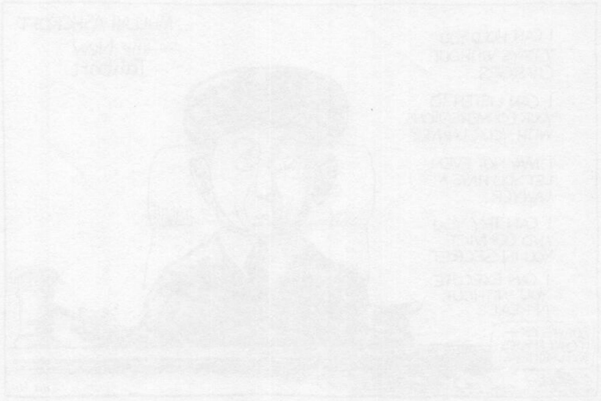
Handwritten text or a small caption located to the left of the photograph.

ACHTSTEDE JAARGANG 1, NUMMER 1 - AUGUSTUS 1982 HIER BEZORGT VAN VERMIJNING, MARKTEN OVER KANTOER EN VOL WASSCHEN EN DEKALFTEIT