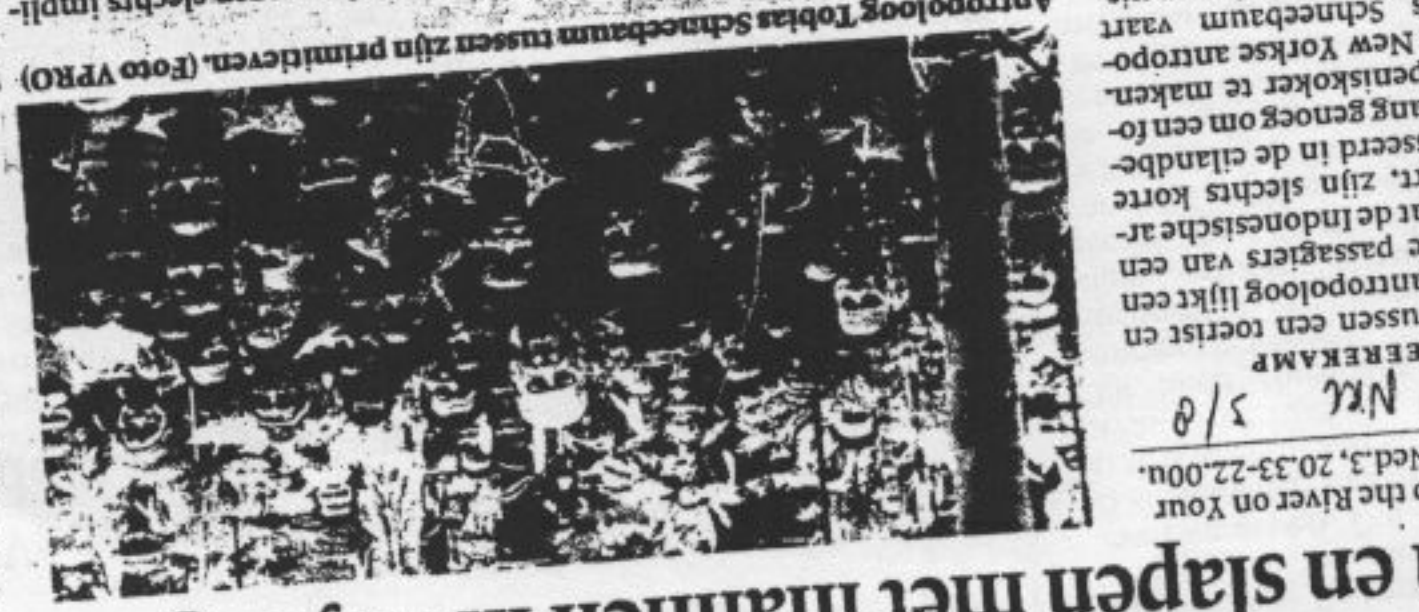
Vrijen en slapen met mannen in de jungle

Daarom is het eerder een schuldzoekende dan een schuld- erop uit zijn hun al dan niet ontdekte lust te bevredigen.